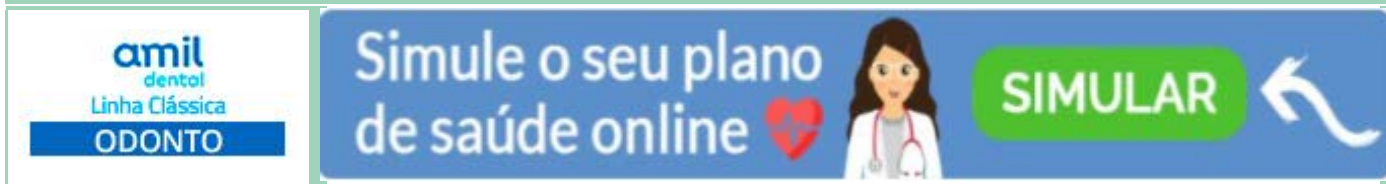
Tabela Amil Dental Linha Clássica - Empresarial - PME

Referência: Outubro/2019 - Taxa de Inscrição: Sem Taxa