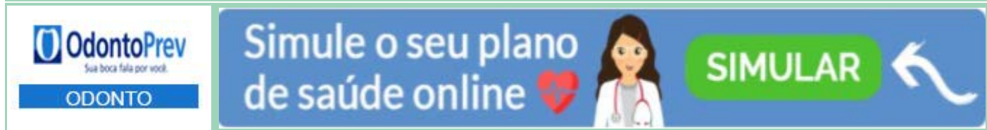
Tabela OdontoPrev - Empresarial - PME

Referência: Outubro/2019 - Taxa de Inscrição: Não informado