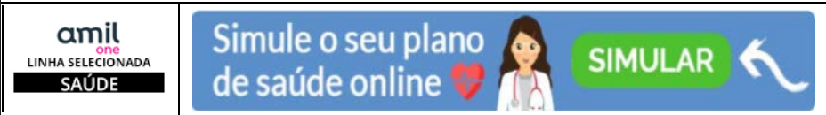
Tabela Amil One | Linha Seleccionada - Empresarial - PME

Referência: Março/2020 - Taxa de Inscrição: Sem taxa